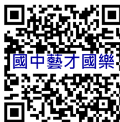
桃園市國民中學藝術才能國樂班 鑑定線上報名系統

主辦機關：桃園市政府教育局 承辦學校：桃園市立福豐國民中學 地 址：桃園市桃園區延平路 326 號 電 話：(03) 366-9547 分機 621、619 傳 真：(03) 218-1138 網 址： https://www.ffjh.tyc.edu.tw/