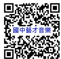
桃園市國民中學藝術才能音樂班 鑑定線上報名系統