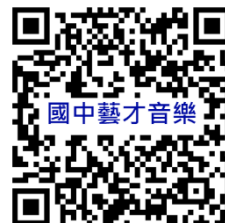
桃園市國民中學藝術才能音樂班 鑑定線上報名系統